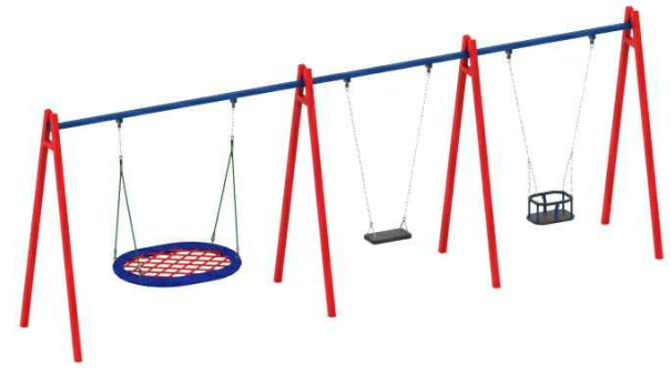
2 - D-4594/3.4