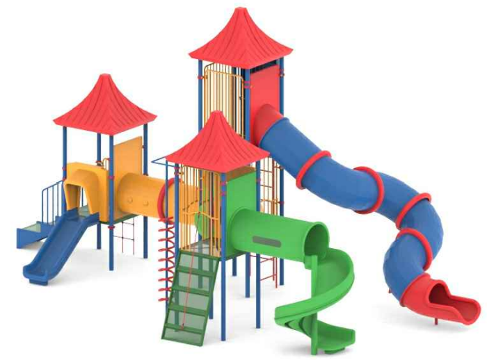
1 - 8066/N8